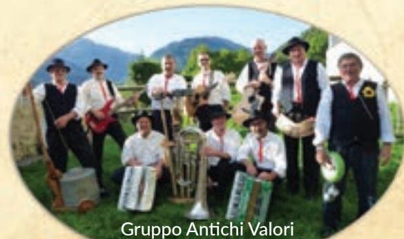
Gruppo Antichi Valori

Alle ore 16.00 per tutti, in piazza, vin brulé, the e dolce del borgo, offerti dall'Associazione Culturale Valorizzazione Rango a chiusura dei Mercatini.